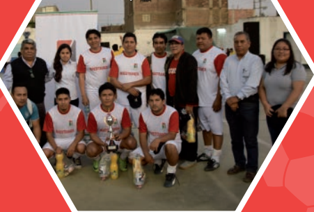
Maestranza Subcampeón menores